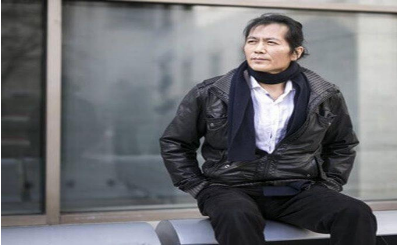
El filósofo sudcoreano residente en Berlín, Byung-Chul Han.

El filósofo sudcoreano residente en Berlín, autor de La sociedad del cansancio , rebate la teoría del pensador esloveno, quien sostuvo que el coronavirus podría ser un golpe mortal contra el sistema económico y eventualmente removería al gobierno chino. “Žižek se equivoca. Nada de eso sucederá”, escribe Byung-Chul Han.