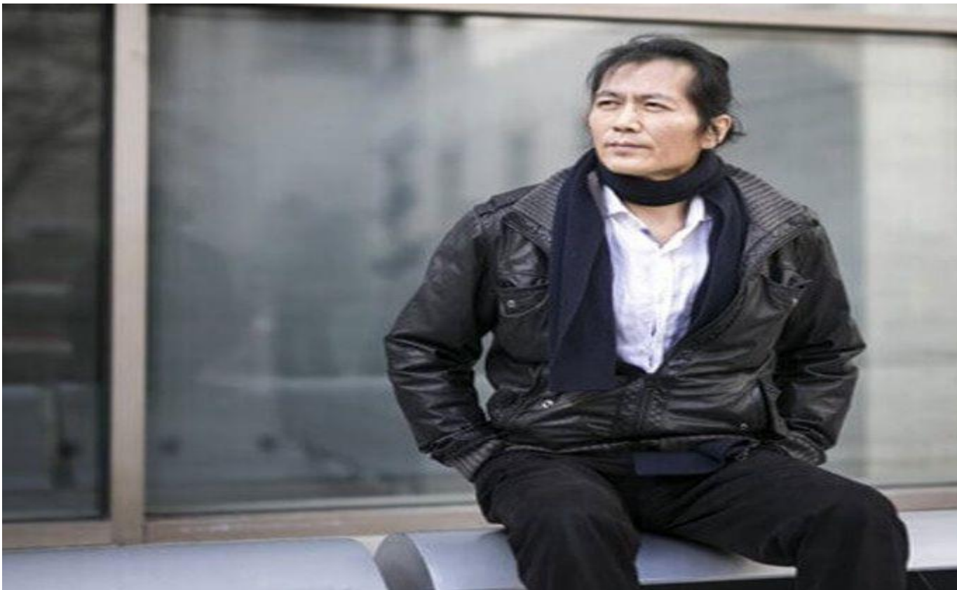
El filósofo sudcoreano residente en Berlín, Byung-Chul Han.