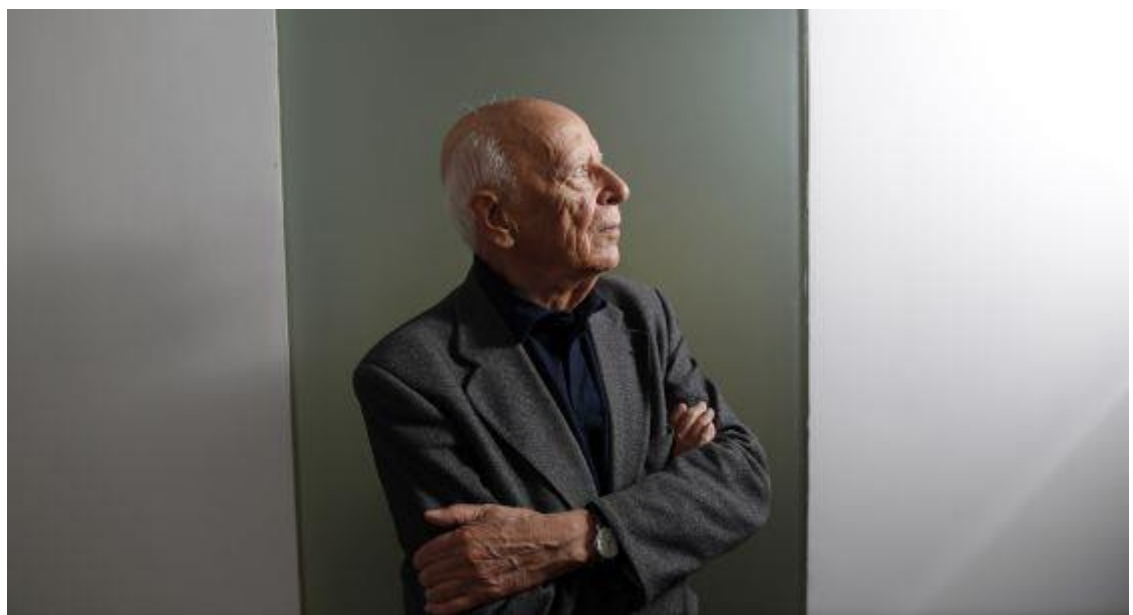
• Emilio Lledó y su trilogía de premios

Respuesta. Bien, dentro de lo que cabe. No me aburro porque tengo la compañía de mis libros y leo. Dialogar con los clásicos es siempre una maravilla, y si cabe más aún en momentos de soledad. Me reconforta mucho en medio de este caos que no alcanzo a comprender.