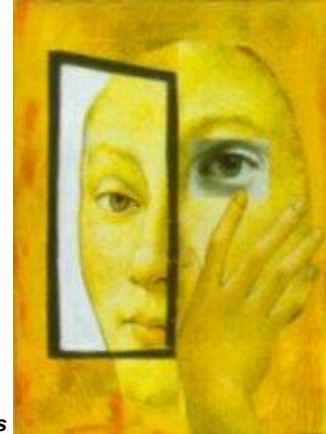
Construimos nuestra manera de ser o êthos

¿Como se adquiere o moldea este êthos , esta manera de ser ? El hombre la construye mediante la creación de hábitos , unos hábitos que se alcanzan por repetición de actos. El êthos o carácter de una persona estaría configurado por un conjunto de hábitos; y, como si fuera un círculo o una rueda, éste êthos o carácter , integrado por hábitos , nos lleva en realizar unos determinados actos , unos actos que provienen de nuestra manera de ser adquirida.